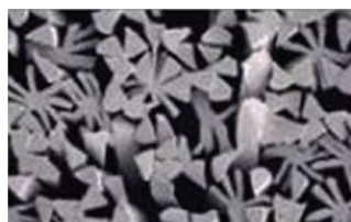
Microparticelle dopo la scissione